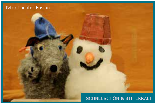
SCHNEESCHÖN & BITTERKALT