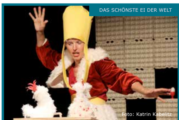
DAS SCHÖNSTE EI DER WELT