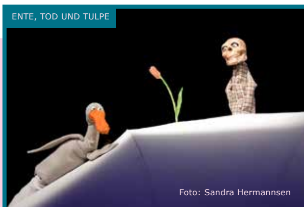
ENTE, TOD UND TULPE