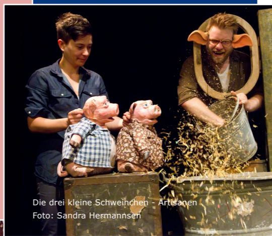
Die drei kleine Schweinchen - Artisanen

Eine politische Theater- Performance, in deren Mittelpunkt die Köpenicker Blutwoche vom Juni 1933 steht. Mit den Puppen als Zeitzeuginnen wird das Publikum nicht nur an diese schrecklichen Geschehnisse erinnert, sondern auch unser Umgang mit der Vergangenheit, mit unserer Erinnerungskultur hinterfragt. So richtet sich das Stück vor allem an die heutige, junge Generation, an die Enkel der Opfer und denen der Täter – es fordert zum Gespräch miteinander auf.