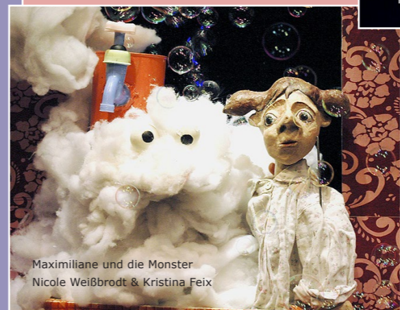
Maximiliane und die Monster Nicole Weißbrodt & Kristina Feix

Der kleine Faulbär langweilt sich ganz fürchterlich zuhause im Bärenwald. Deshalb stiftet er seinen Freund, den Federbär, zu einer unverhofften Reise an. Als sich Faulbär plötzlich allein auf weiter Flur wiederfindet, staunt er nicht schlecht über die unterschiedlichen Bären – Flugbär, Schimpfbär und Schlingelbär – die ihm nach und nach begegnen. Ob diese ihm dabei helfen können Federbär wiederzufinden?