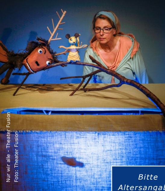
Nur wir alle - Theater Fusion