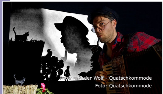
Peter und der Wolf - Quatschkommode

DE: Die Kinder werden nach China, in das Schloss eines chinesischen Kaisers eingeladen. Es ist die poetische Geschichte "Vom Schönen im Einfachen", die musikalisch und märchenhaft erzählt wird. Nach circa 45 Minuten findet die Geschichte ihr gutes Ende. DA: Børnene bliver inviteret til Kina, i den kinesiske Kejsers slot. En poetisk historie om "skønheden i det enkelte", som bliver fortalt musikalsk og eventyrligt. H. C. Andersens eventyr danner midtpunktet for en historie, hvor børnene får mulighed for at have indflydelse på forløb og handling.