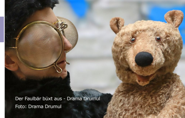
Der Faulbär büxt aus - Drama Drumul